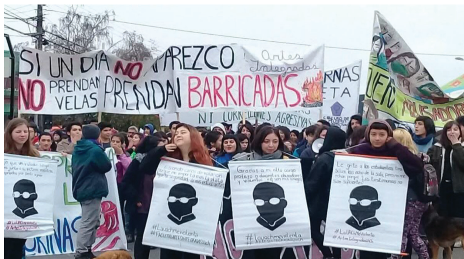
Figura 1. Mayo 2018, protesta feminista universitaria en Valdivia, Chile