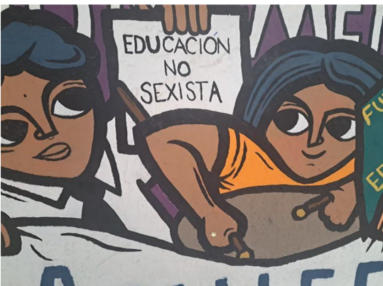
Figura 2. Fracción de mural en pasillos de Facultad de Ciencias Sociales, Universidad de Chile