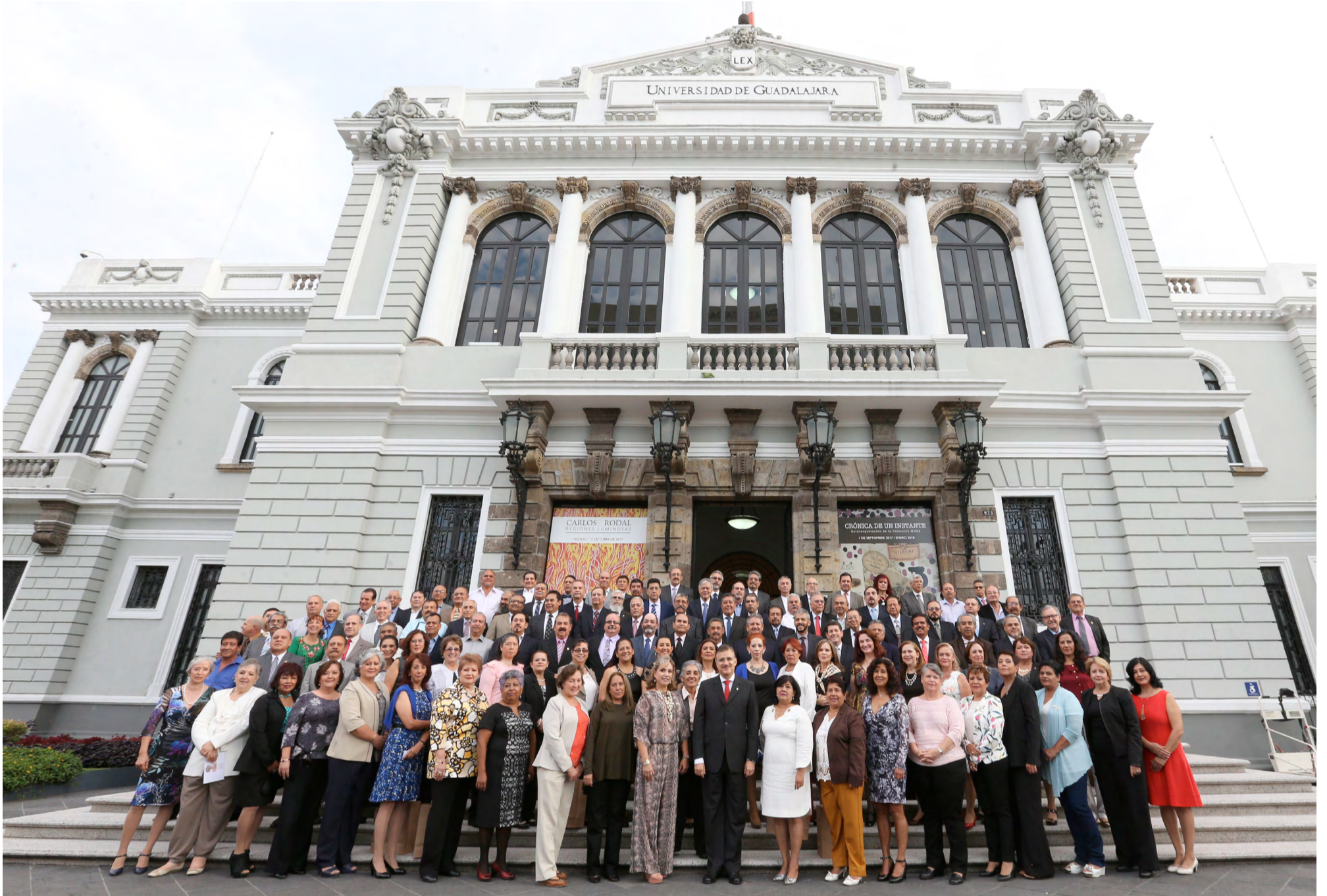
A 92 años de su refundación, nuestra Casa de Estudio cuenta con poco más de 270 mil estudiantes de nivel medio superior y superior.

Reconoció este jueves a 235 académicos y administrativos por 35 años de labor