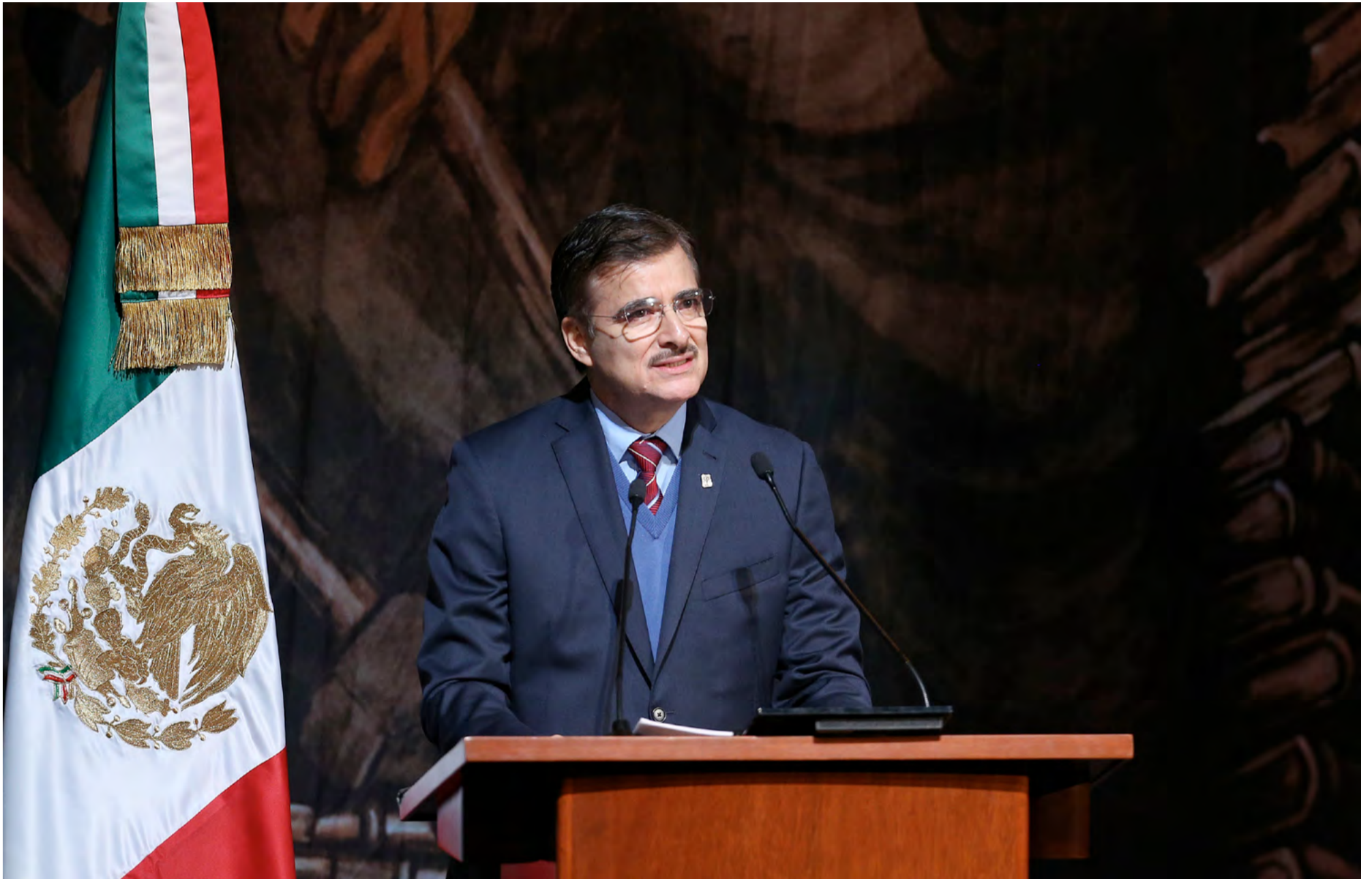
La UdeG es líder nacional en posgrados de calidad del PNPC con 151 programas, informó el Rector general de la institución, Mtro. Itzcóatl Tonatiuh Bravo Padilla.

Este viernes analizará un programa para recibir a los estudiantes que sean deportados de Estados Unidos