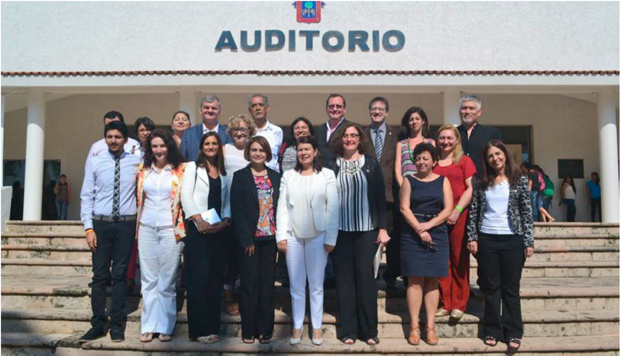
La UdeG, a través del Sistema de Universidad Virtual (SUV) fue anfitriona del encuentro en CUCosta.

Consejo de Rectores de Aula CAVILA celebra sesión anual en CUCosta