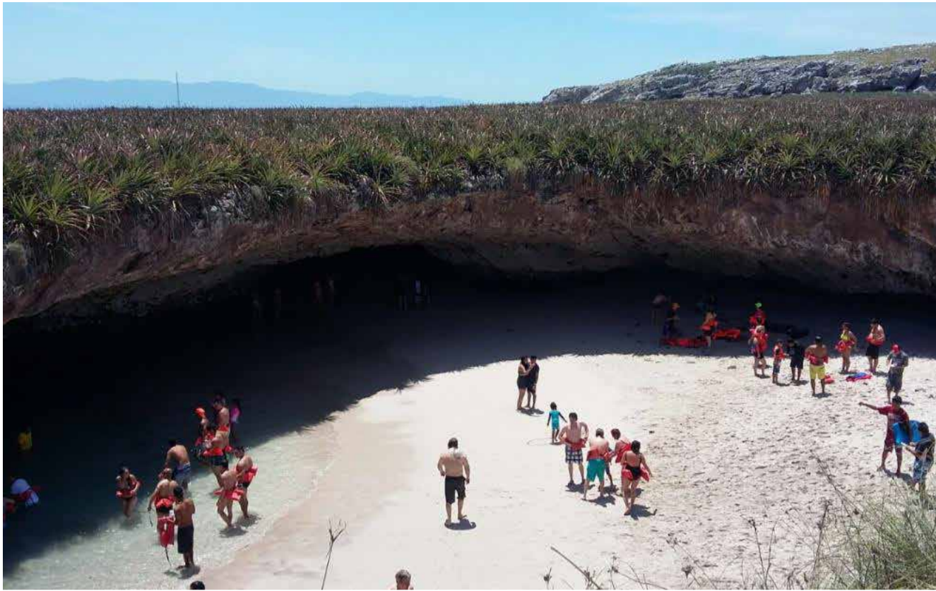
Playa del amor.