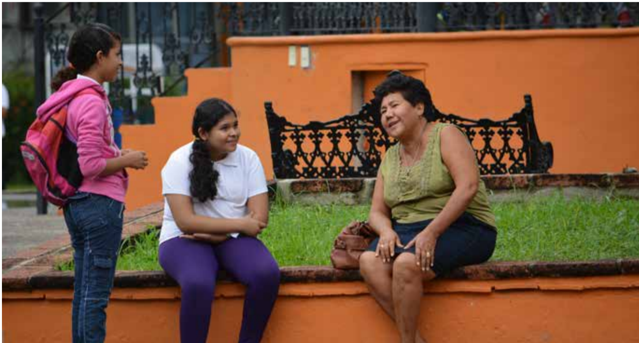
La violencia hacia la mujer se presenta por razones culturales.

Más que decretar una alerta de género en Jalisco es necesario plantear políticas de Estado a largo plazo: investigador del CUCosta