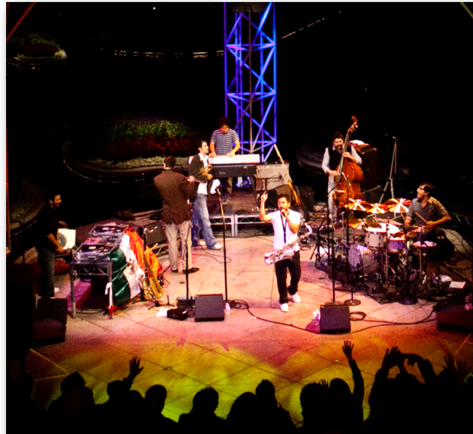
Grand Performances, Los Ángeles, CA.

Verlos tocar en vivo es una experiencia apasionante, los Troker pasan del jazz más puro, a lo sicodélico total. Conaculta. Ver nota